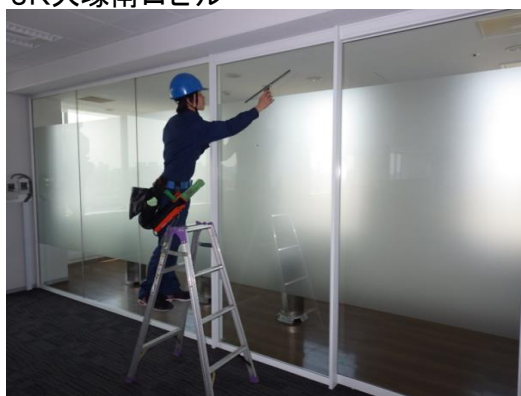
◆JR東日本ビルディング株式会社 様 JR大塚南口ビル