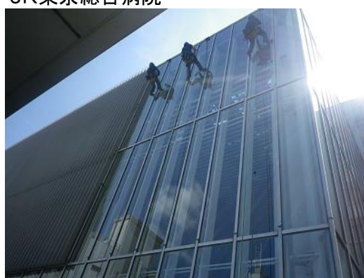
◆東日本旅客鉄道株式会社 様 JR東京総合病院