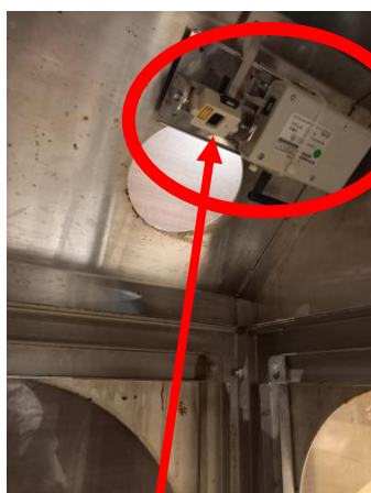
ゴミ箱内部センサー